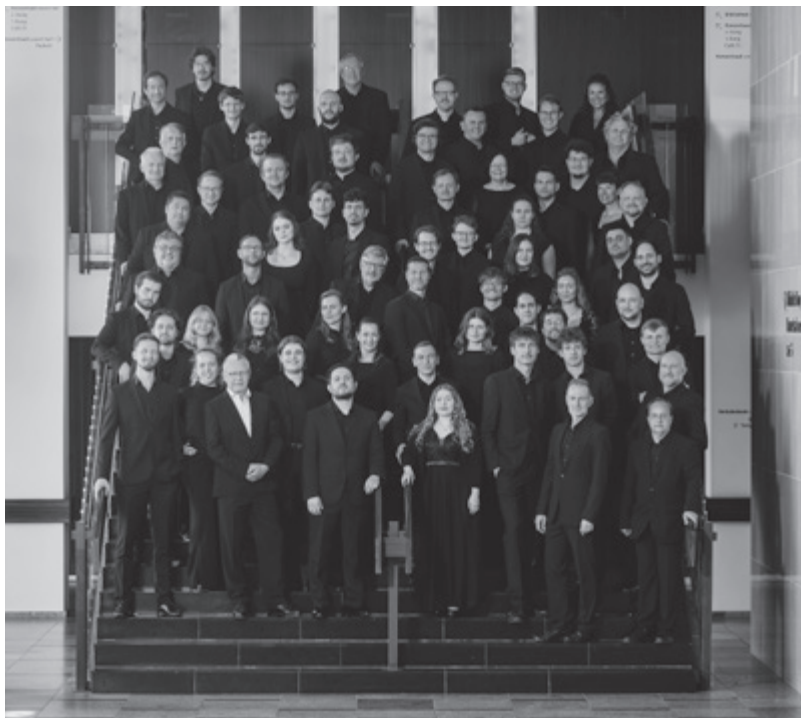
Dresdner Festspielchor und Chor der KlangVerwaltung