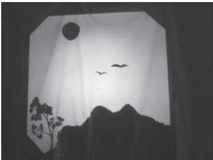
Schattenbild der Klasse 5c des Humboldt-Gymnasiums Solingen